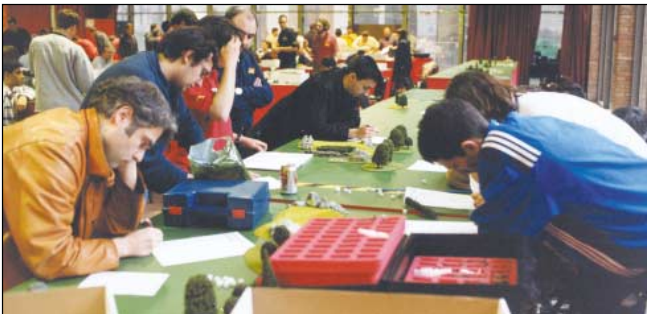
La nutrida participación portuguesa se dedicó con ahinco a demostrar sus conocimientos del hobby en el test.